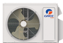
Condenseur 18 000 BTU/h