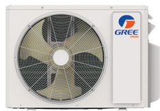
Condenseur 24 000 BTU/h