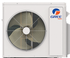
Condenseur 30 000, 36 000, 42 000 et 48 000 BTU/h