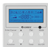
EN OPTION Thermostat filaire XE-71