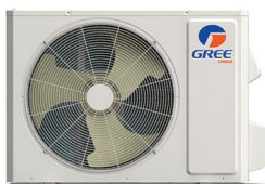
Condenseur CROSSOVER R32