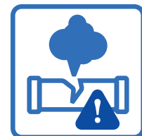
Détecteur de fuite sur TOUTES les unités murales